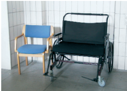
Fig. 9. Viser en kørestol som kan klare en vægt på 350 kg ved siden af en almindelige stol.