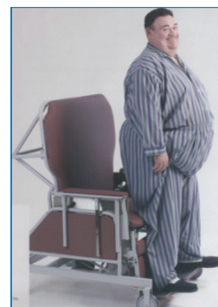
Fig. 3. Eksempel på en svært overvægtig mand.

Vægtstigning hos psykiatriske patienter udgør et specielt problem, idet vægtstigningen kan skyldes både medicin og den psykiske tilstand. På mange psykiatriske afdelinger gøres en stor indsats mod overvægtsproblemer.