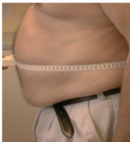
Fig. 1. Måling af taljen sker midt mellem hoftebenet og nederste del af brystkassen. Den abdominale fedmegrænse starter i Europa ved et taljemål på 80 cm hos kvinder og 94 cm og i USA ved 88 og 102 cm.

De skadelige virkninger af svær fedme sætter ubarmhertigt ind. Problemer som følge af ekstrem overvægt er mangfoldige. Fig. 6. Med