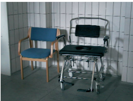
Fig. 8 viser en badebænkstol som kan klare en vægt på op til 300 kg ved siden af en alm. stol som kan klare 100-130 kg.